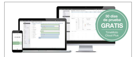
El software basado en la nube permite gestionar la presencia, los horarios y realizar informes desde cualquier lugar y en cualquier momento