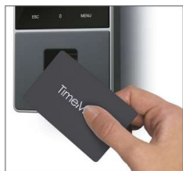
Fichar con huella dactilar, RFID o PIN